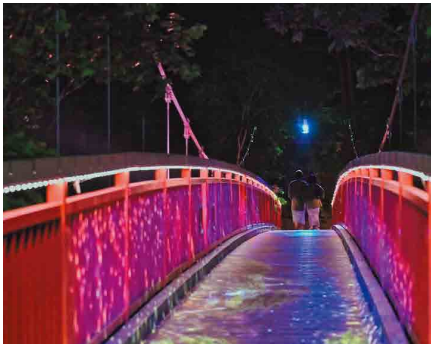
イルミネーション部門