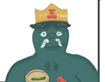
イラスト:イラストレーター 田中マリナ